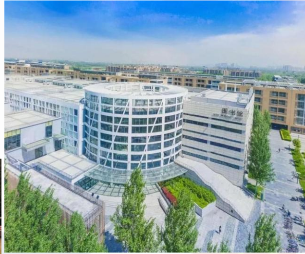
The library has a collection of 3.2374 million paper books and 17.26 million digital books.